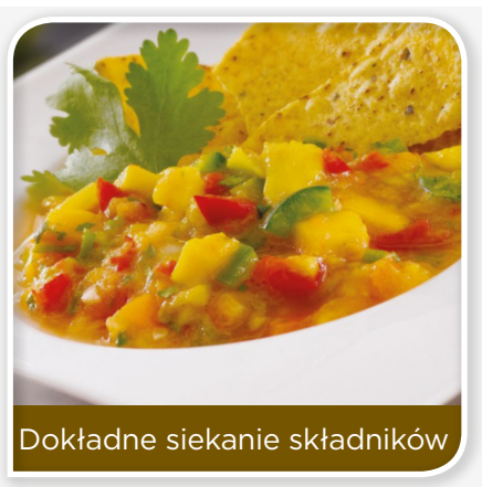
Dokładne siekanie składników